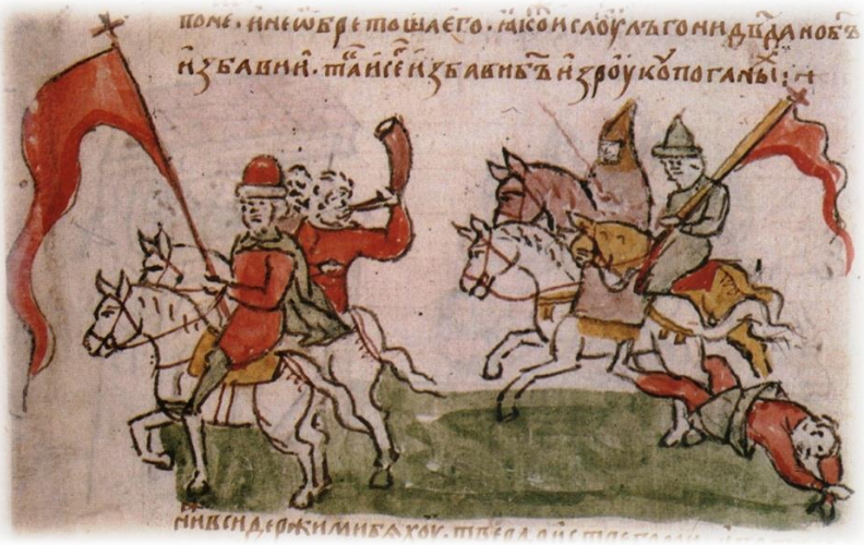
Бегство князя Игоря из плена [Радзивилловская летопись, 1994, ил. 590]

Неясна фраза « нъ розно ся имъ хоботы пашють », внимание останавливает название хоботы . Но в Радзивилловской летописи развевающиеся на ветру значки копий направлены в разные стороны только на миниатюрах, изображающих княжеские конфликты . Сабли же – это оружие, враждебное для русских дружинников , а по летописям (по их текстам и соответственно по рисункам к ним) – это ещё и орудие предательских убийств [Там же, с. 18].