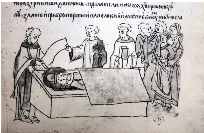
Панихида по убиенному князю Андрею Боголюбскому. Человек с книгой рядом со священниками – Кузьмище Киянин (автопортрет) [Радзивилловская летопись, 1902, ил. 544]