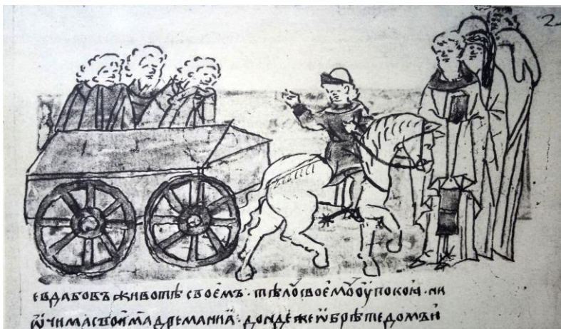
Проводы гроба с телом Андрея Боголюбского во Владимир. Человек с книгой – Кузьмище Киянин [автопортрет. – Е. С.] [Радзивилловская летопись, 1902, ил. 546]