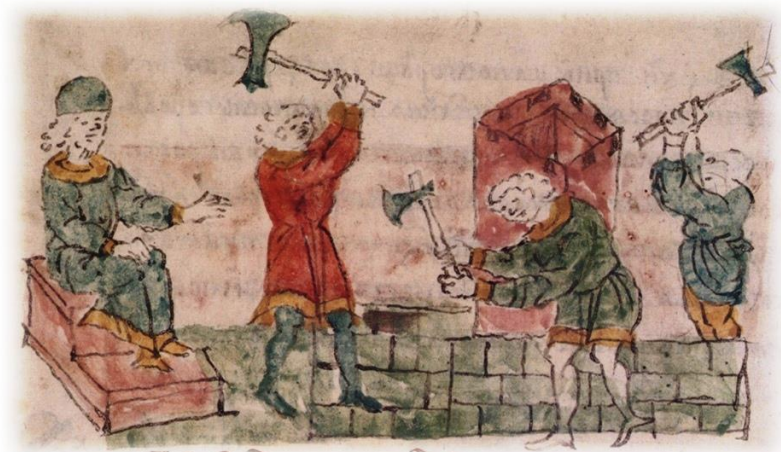
Строительство Успенского собора во Владимире. Архитектор – Кузьмище Киянин (автопортрет) [Радзивилловская летопись, 1994, ил. 516]

Исследователь объясняет это так: «...кто строил владимирские и суздальские храмы, тот и рисовал их на миниатюрах к летописи, а это значит – там и там присутствует рука Кузьмища » [Бурькин, 2017, с. 15].