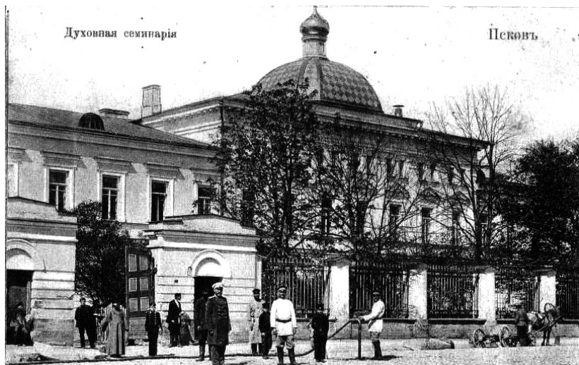
Псковская духовная семинария.

на вакантную профессорскую должность помощника ректора. С 1854 года он преподавал в миссионерском отделении историю раскола и его обличения, а с 6 мая 1855 года – и еврейский язык.